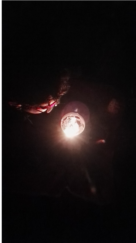
Ein Einblick in der Existenz

Das Feuer der Tradition brennt und brennt noch, weitere Reisen kommen im Plan und weitere Erfahrung werden wir erleben.